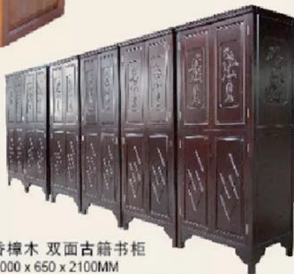
香樟木 双面古籍书柜 1000 x 650 x 2100mm