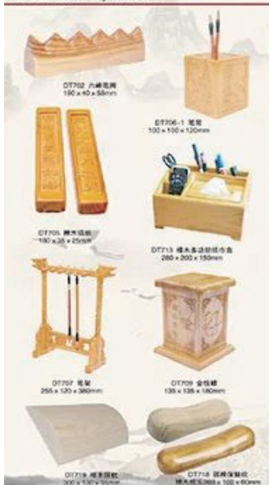
DT702 六峰笔筒 180 x 40 x 55mm