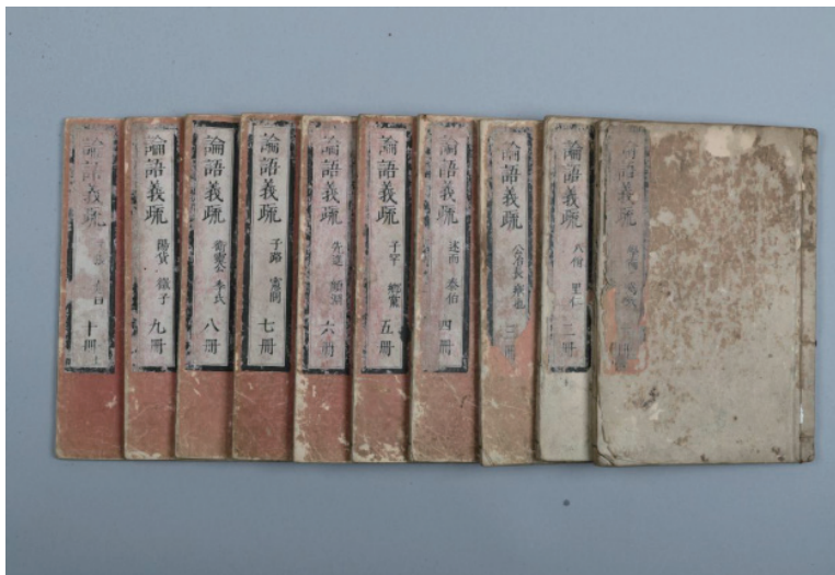
日本宽延庚午年(1750)刻本《论语集解义疏》十册