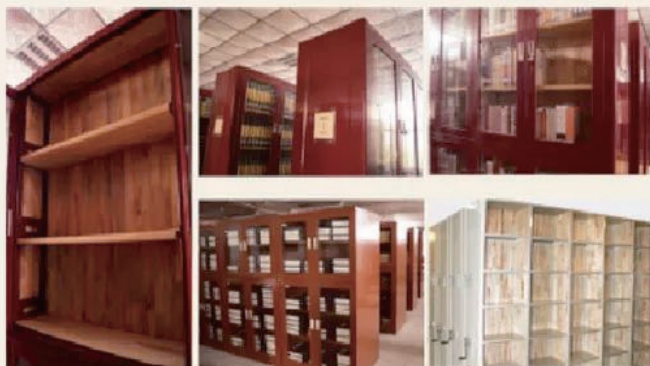
DT138 密集架书柜香樟木内层板(定做尺寸)