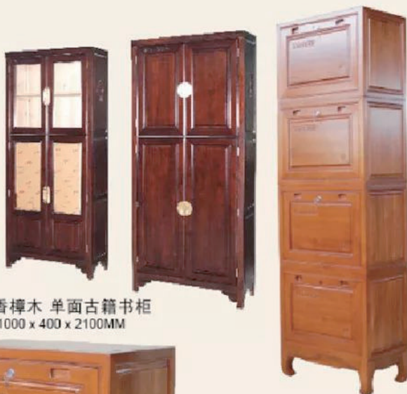
香樟木 单面古籍书柜 1000 x 400 x 2100mm