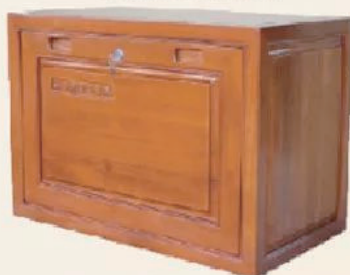
DT101 古籍书柜 730 x 410 x 500mm