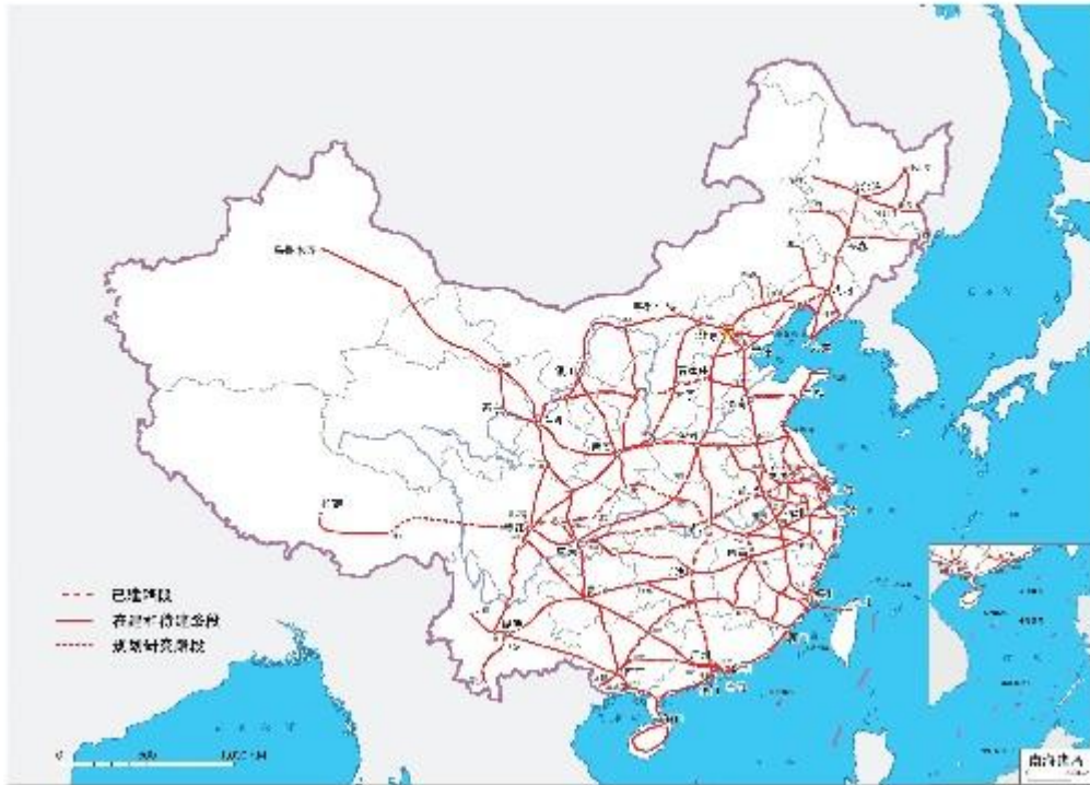
图2 国家快速铁路网