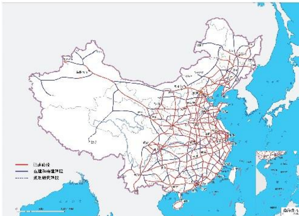
图3 国家高速公路网