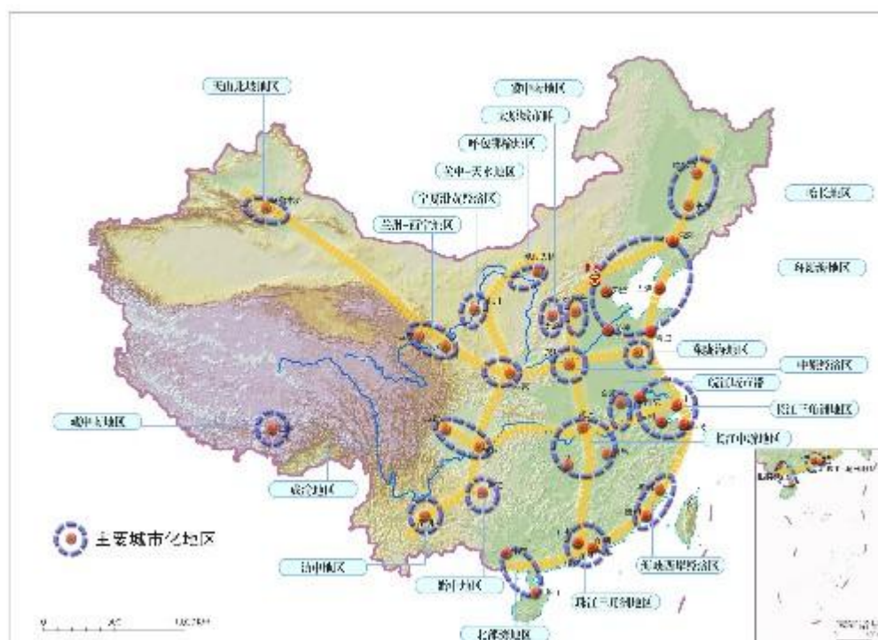
图4 “两横三纵”城市化战略格局