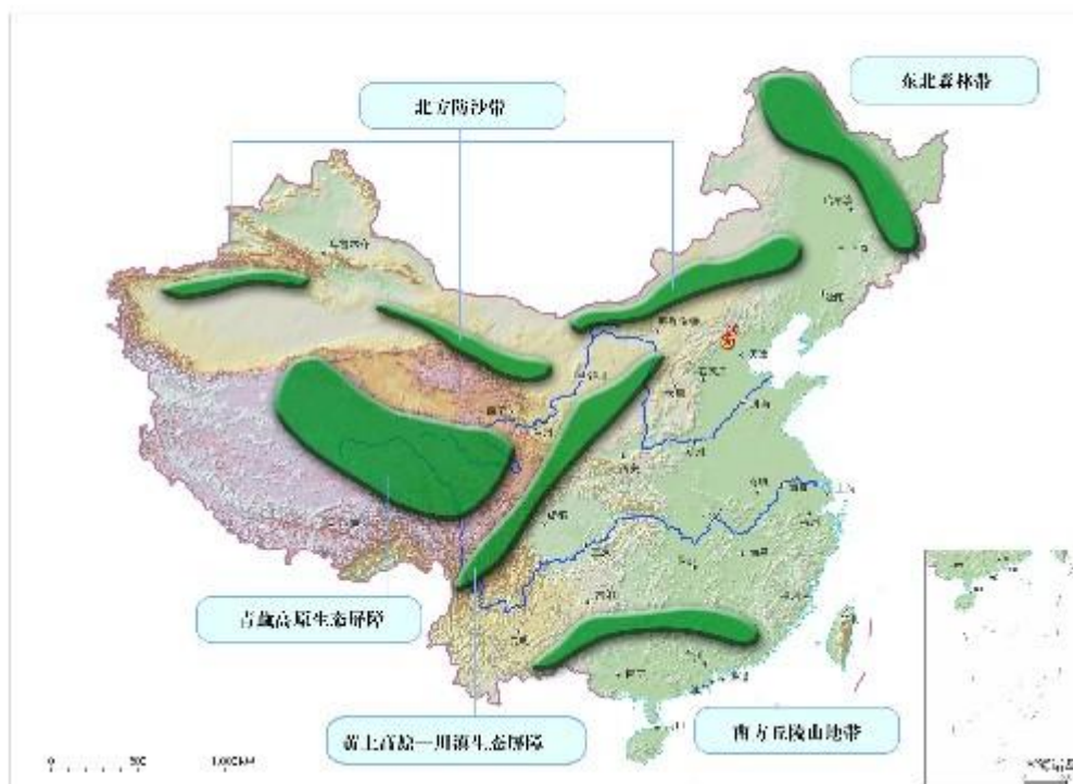
图 5 “两屏三带”生态安全战略格局