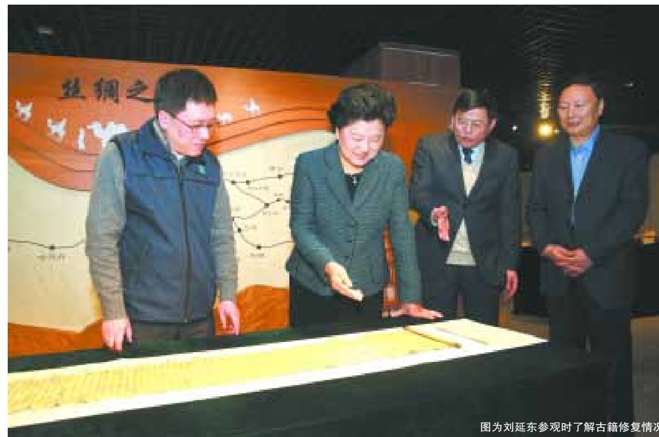
图为刘延东参观时了解古籍修复情况

10月31日，中共中央政治局委员、国务院副总理刘延东在参观国家图书馆“民族记忆精神家园——国家珍贵古籍特展”和“红色记忆——纪念中国共产党成立95周年馆藏文献展”时强调，