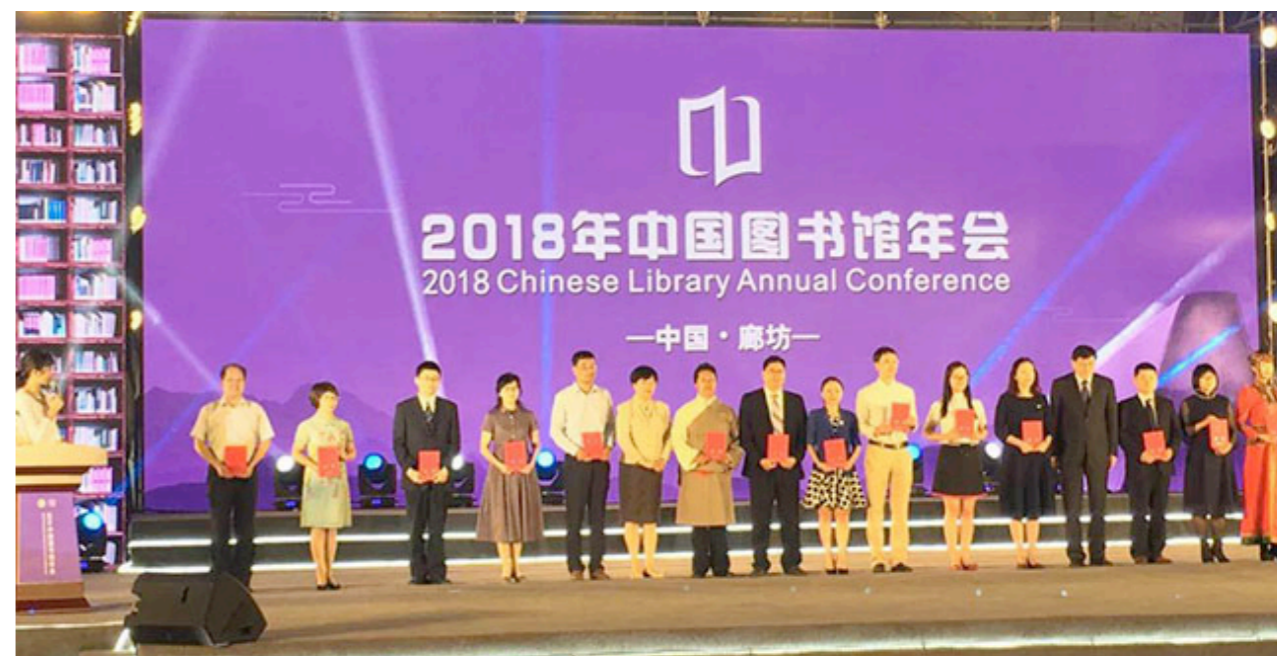
中国古籍保护协会会长刘惠平等应邀为“中国图书馆最美故事”之“优秀服务”代表颁发证书

“2018 年中国图书馆年会·中国图书馆展览会”于 5 月 30 日 -6 月 1 日在河北廊坊国际会展中心隆重举办，由中国古籍协会组织的“中华古籍保护计划·第二届全国古籍保护技术与装备展示区”活动，在本次年会上再度受到与会代表的欢迎。