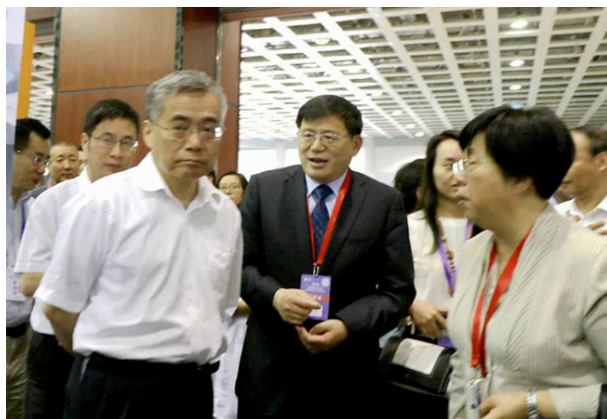
国家图书馆馆长韩永进陪同文化和旅游部副部长项兆伦参观古籍保护技术与装备展示区

西安玢复公司“无酸档案文献保存盒”等一些系列明星产品，也引起了到场观众的浓厚的兴趣。