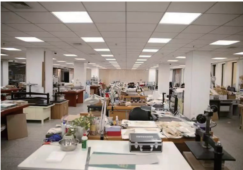
国家图书馆古籍修复室光源改造前后对比