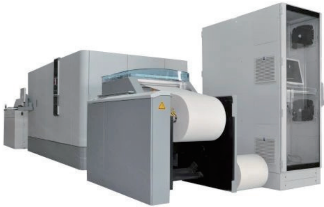
高速汉纸数字水墨连续印刷系统