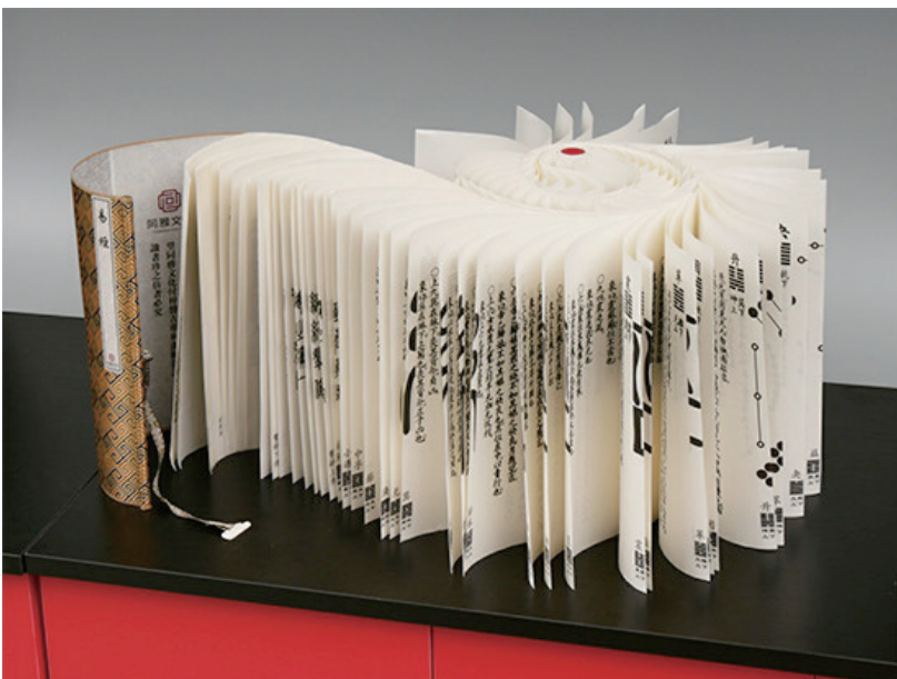
经折装《富春山居图》