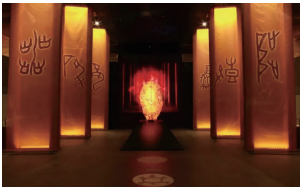
“甲骨文记忆展”中的互动场景

理与利用、古籍鉴定与保护为主题，邀请业内相关专业重量级学者进行分享，课程内容和形式得到业内学员和社会各界的热烈反响，在各种传播渠道频频“刷屏”，疫情期间为大家居家工作学习提供了精神食粮。依托于国家图书馆宏富馆藏，以展示中国典籍、弘扬中华文化为宗旨，国家典籍博物馆2022年也在跨界联合推动古籍“活”化方面取得显著成效，先后斩获多个奖项。“《共产党宣言》专题展”获得由国家文物局主办的2022年度“弘扬中华优秀传统文化、培育社会主义核心价值观”主题展重点推介；“甲骨文记忆展”获得由中国博物馆协会、中国文物报社联合主办的“新时代博物馆百大陈列展览精品”荣誉；“珠还合浦历劫重光——《永乐大典》的回归和再造”获得北京市文物局、北京博物馆学会举办的“2021年度北京市博物馆优秀展览”；“喜迎二十大强国复兴有我——青少年中华文物我来讲”荣获中央宣传部志愿服务促进中心、国家文物局博物馆与社会文物司优秀博物馆志愿服务推介项目。近期，国家典籍博物馆还列入北京市首批31家打造