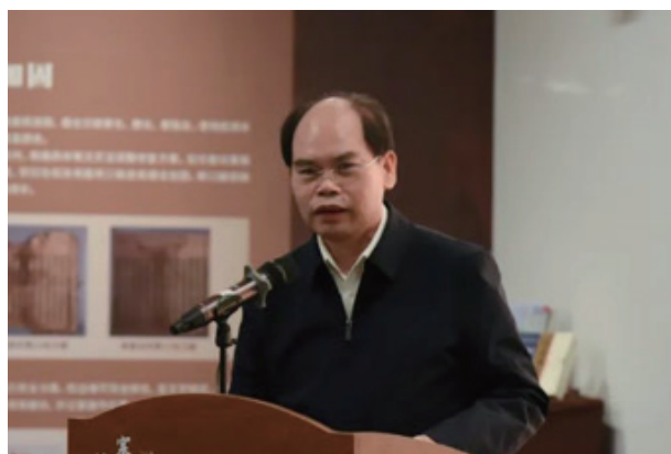
国家图书馆馆长、国家古籍保护中心主任 熊远明致辞

展览全方位、立体式展示了国家图书馆藏西夏文献保护修复成果,旨在深入学习党的二十大精神,贯彻落实《关于推进新时代古籍工作的意见》《2021—2035 年国家古籍工作规划》,向业内和社会宣传推广社会力量积极参与国家古籍保护的