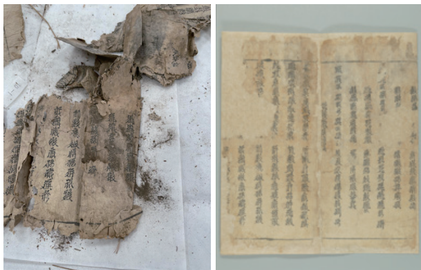
西夏文献修复前后对比图

在多方共同努力下，通过五年多的努力，130余册（件）西夏文献完成抢救性修复工作。作为国家级非物质文化遗产代表性项目“装裱修复技