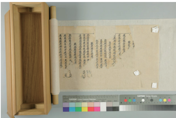
西夏文献修复前后对比图