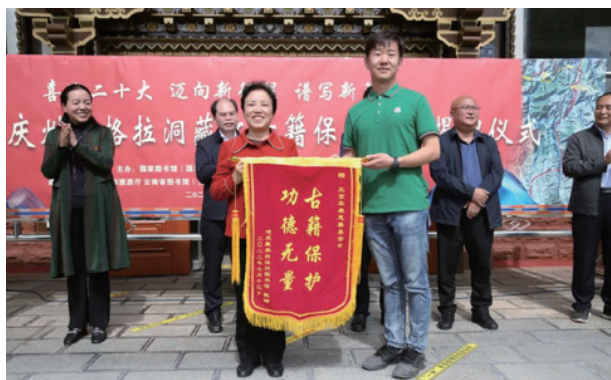
苹果慈善基金会公益捐助实施纳格拉洞藏经存藏保护项目

国家图书馆（国家古籍保护中心）持续推进“三位一体”人才培养模式，为古籍事业做好人才支撑。开展了系列线上线下专业培训、设立了32家国家级古籍修复技艺传习所、积极推动学科体系建设，尤其是通过录课的方式面向业界和社会公众推出两期线上培训，分别以图书馆古籍整