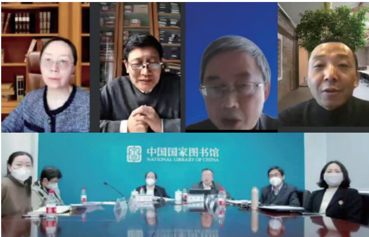
国家图书馆等 6 家单位在线召开古籍数字资源联合发布会

古籍保护中心和古籍存藏单位，加大古籍数字资源共享发布力度，向社会提供更加便捷的古籍公益性服务；完善“中华古籍书目数据库”；加快推进全国古籍资源统一检索发现系统建设，实现古籍数字资源一键直达。同时，积极对接国家文化大数据体系，推动实现古籍数字化资源汇聚共享。