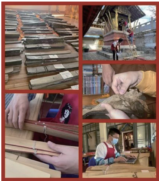
云南傣文古籍保护志愿服务团队工作留影

古籍保护文化志愿服务成效的取得，得益于文化和旅游部的高度重视，国家古籍保护中心的精心指导，各级古籍保护中心的积极配合