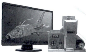
图 5 RSPRO-I 型阅读机产品图片

公元 8 世纪末, 吐蕃赞普赤松德赞在位时 (755- 797), 佛教得到很大的发展, 兴建了桑耶寺, 从印度等地邀请了诸多班智达及培养了本地译师, 同时在桑耶寺的梵文译院内共同翻译了佛教典籍文献。将山南东塘丹噶宫