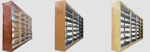
HS-SJ04 钢木书架 W3600xD450xH2200