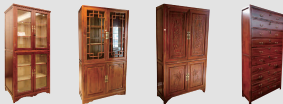
HS-BG04 双面古籍柜 W1000xD650xH2100 HS-BG05 双面古籍柜 W1000xD650xH2100 HS-BG06 单面古籍柜 W1000xD400xH2100 HS-BG07 十斗书画柜 W1000xD600xH2100