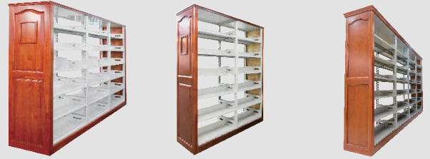
HS-SJ01 钢木书架 W2700xD450xH2100

钢木书架侧板采用实木橡木制作，橡木纹理清晰，充分彰显绿色自然品位，整体效果端庄气派，尽显古典文化与现代文明之内涵，更显品位和风范，倍增细腻美观的视觉效果。